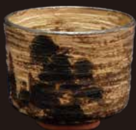
銹泐松籟茶碗(六代 清水六兵衛作)