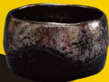
大樋黒茶碗(大樋年朗作)