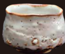
志野茶碗(鈴木蔵作)