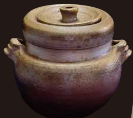
備前水指(藤原雄作)