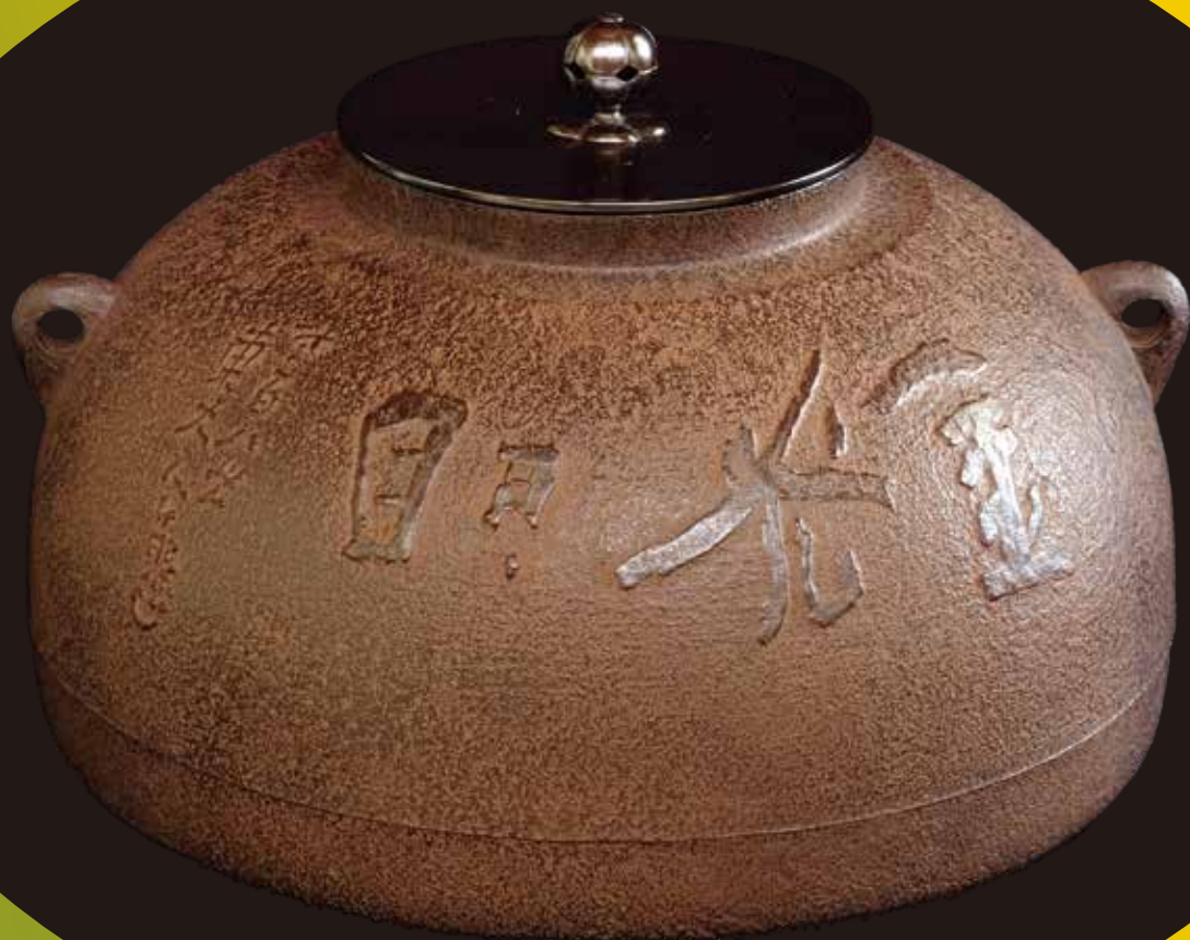
「金光明」陽鍍撫肩釜(角谷一圭作)