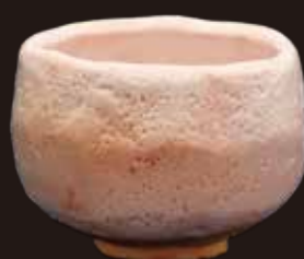
志野茶碗(加藤孝造作)