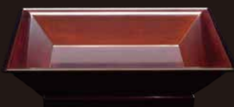
四方盆(松田権六作)