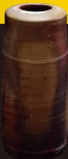
備前花入(藤原啓作)