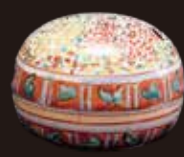
着彩人物文香合(加藤卓男作)