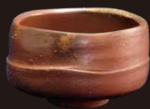
備前茶碗(伊勢崎淳作)